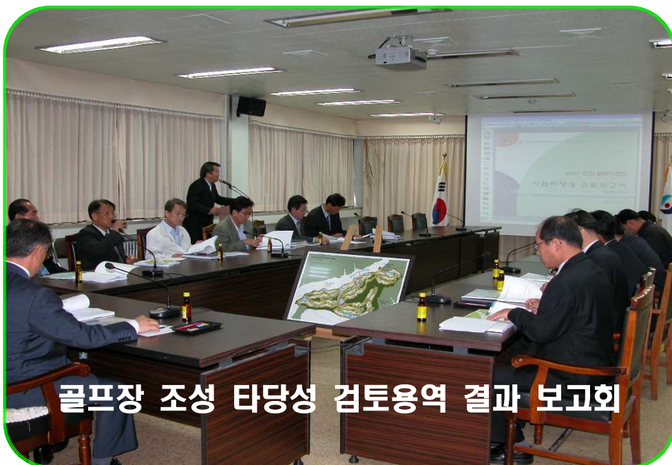
골프장 조성 타당성 검토용역 결과 보고회