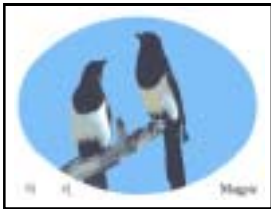
군조 : 까치