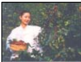
군목 : 대추나무