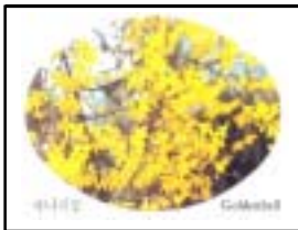
군화 : 개나리